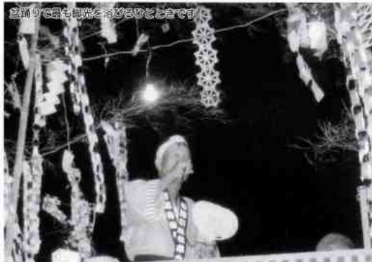
盆踊りで最も地味な踊りかごとです