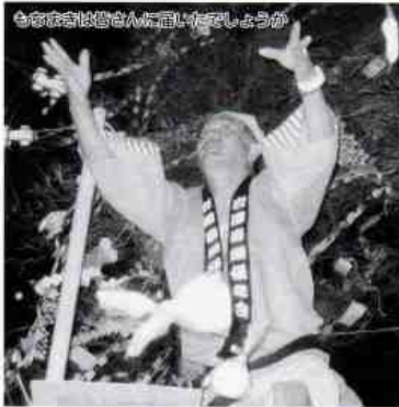
ももたねは皆さんに向けてしようが

発行所 平田地区社会福祉協議会 ひらた新聞編集部 (岩国市平田出張所内) 岩国市平田3丁目22-18 印刷所 フジ英新印刷機 岩国市今津町2丁目2-52