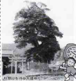
秋祭りを待つ大歳神社