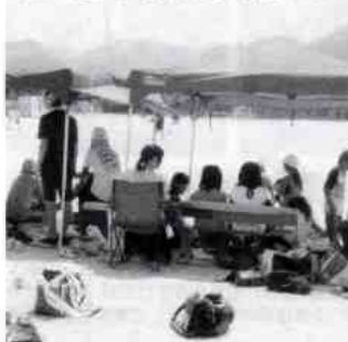
テントを張っての応援団が選手を後押しします