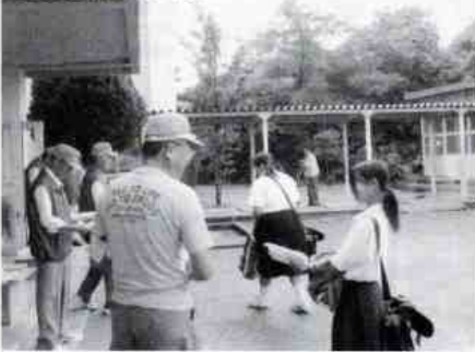
服装検査の様子が始まります