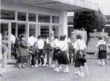
校長先生は先頭にたつての協力で