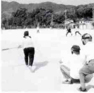
2塁ランナーを進めるつもりでしたがフライになりました