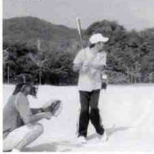
左足がこれから前にでます。大きい当たりとなりました