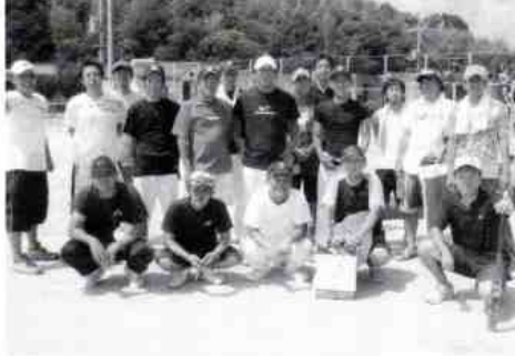
優勝した平田ヒルズAの皆さん