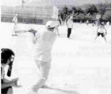
センター前ヒットが