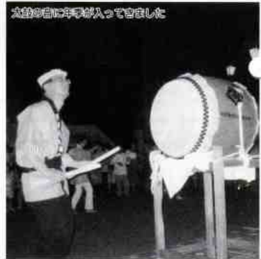
式始めの自に早転がって喜ばれた