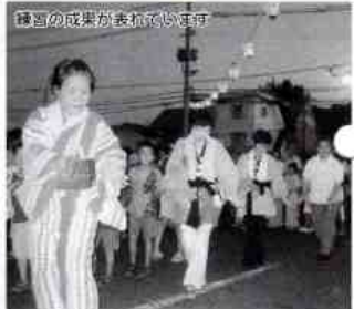
練習の成果が表れていました

平田地区盆踊り大会を開催 8月1日(日)、平田地区盆踊り大会が中央フード平田店駐車場で盛大に開催されました。18時40分から、教蓮寺ご住職の説経の中、この1年間の平田地区物故者の慰霊式がしめやかに行われ、19時から幼稚園児、保育園児、子供会、婦人会、長寿会、岩国音頭保存会、一般あわせて総勢760人の演技者を数えました。 今年は、ことのほかの暑さにかかわらず、元氣一杯の踊りが繰り広げられました。ご芳志いただきました各企業、商店、団体、個人の皆様に改めて厚くお礼申し上げます。 毎年会場の提供に快く応じていただき中央フード平田店に改めてお礼申し上げます。 また、準備、進行、後片付けと最後まで協力をいただいた関係者の皆さんに感謝申し上げます。