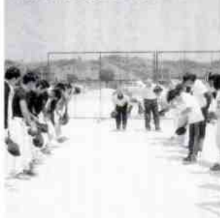
試合前の挨拶は礼儀正しく行います