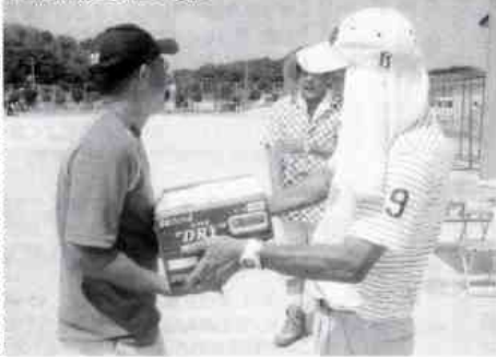
優勝賞品は生の缶ビールだ