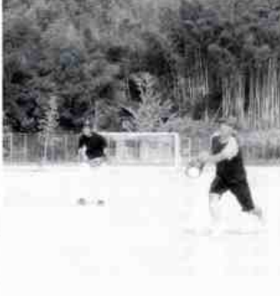
思いがけずからピッチャーは好球です