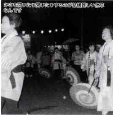
かさを回したり扇じたりするのが気持ちいい位早転んで