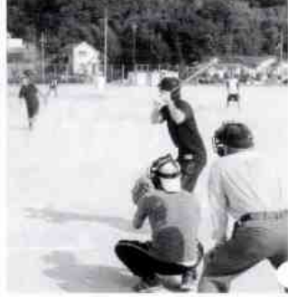
早稲的捕球に選手が一心をこめて