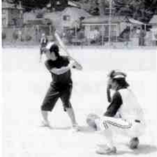
選手を応援の手や声で応援球を待たます