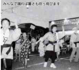
みんなで踊れば暑さも吹っ飛びます