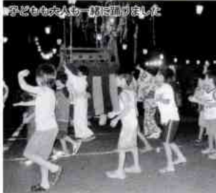
子どもも大人も一緒に踊りました