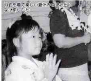
浴衣を着て楽しい夏休みの思い出になりましたか