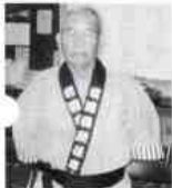
若国音頭保存会のオールキャスト

今後の練習は年間をとおし、毎週水曜日の19時から行っており、会員数は28名となっています。先足3年目をむかえ、今では音頭、太鼓打ち、踊りと格段に上達し、8月1日の平田地区盆踊り大会では成果を発揮して